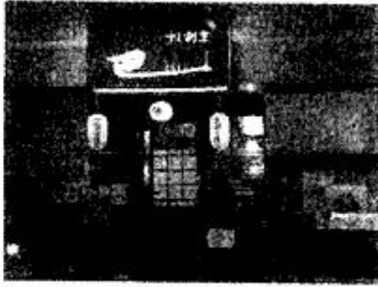
武蔵小山繁華街 16,100円