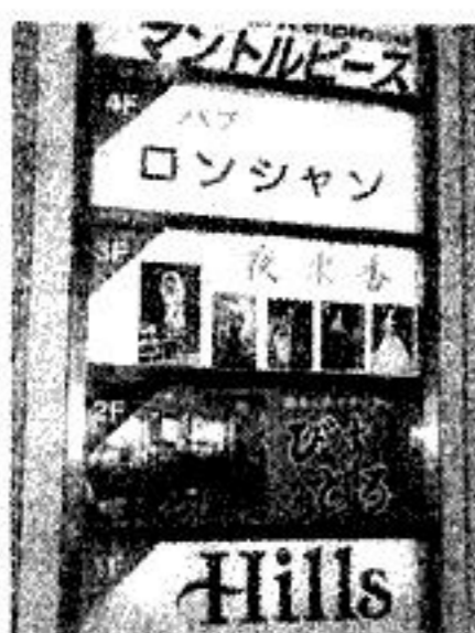
大森駅周辺パブ、バー、ヒールズ 11,000円