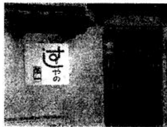
桐ヶ谷の寂しいところ 6,090円