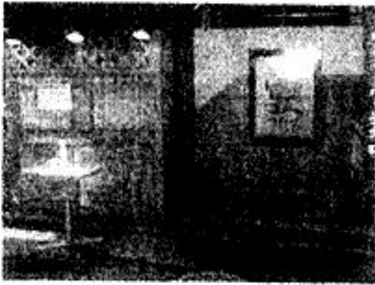
大崎広小路交差点 15,200円