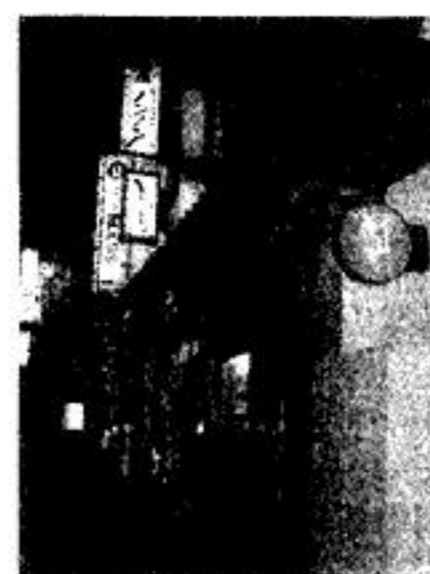
大井駅周辺飲食街 53,000円