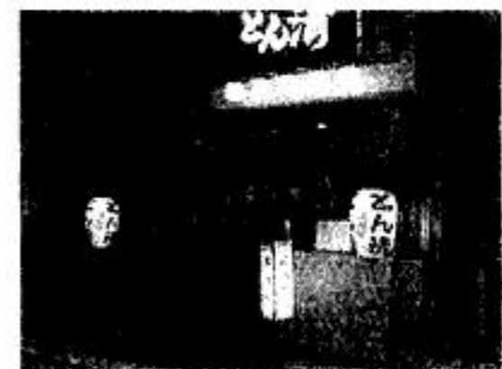
大崎広小路交差点 18,000円