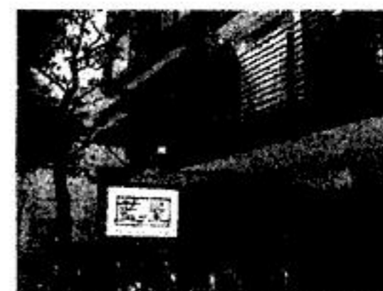
大森駅への池上通り 11,004円